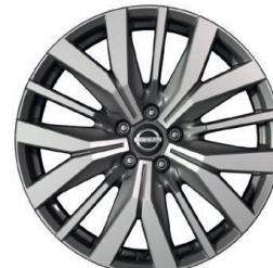
Tekna+ 20" ar dimantu slīpēti vieglmetāla diski