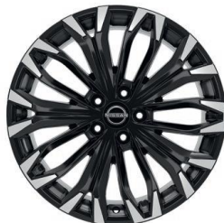
Tekna & N-Connecta 19" ar dimantu slīpēti vieglmetāla diski