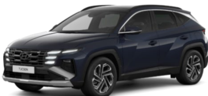
Sailing Blue (U2P) Metāliska krāsa