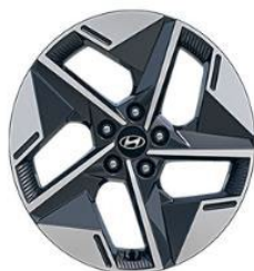
Style 18" vieglmetāla diski 235/55/R18 riepas