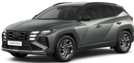
Pine Green Matte (RB2) Pine Green Matte / Phantom Black jumts (RB0)