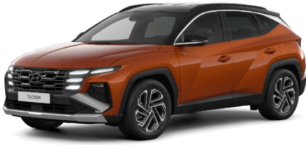
Jupiter Orange / melns jumts (PL0)