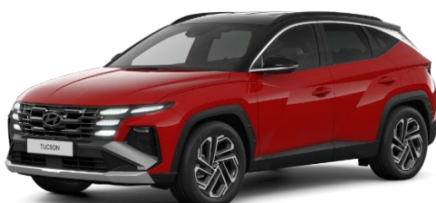
Engine Red / melns jumts (JH0)