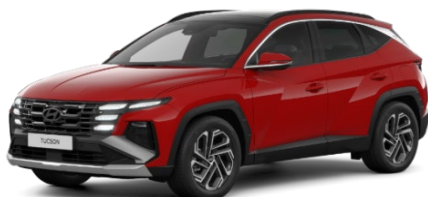
Engine Red (JHR), nemetāliska Bez maksas