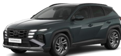
Cypress Green (T2P) Perlamutra krāsa