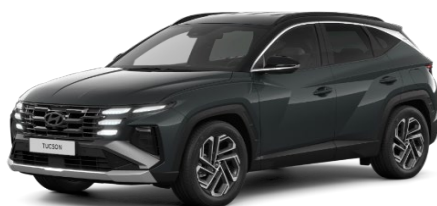
Cypress Green / melns jumts (T20)