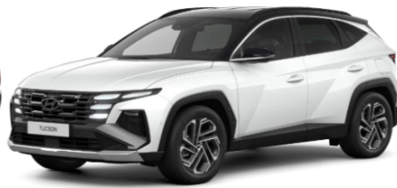
Serenity White / melns jumts (W60)