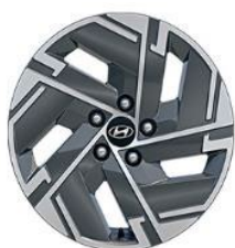
Comfort 17" vieglmetāla diski 215/65/R17 riepas