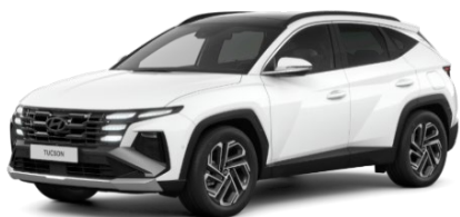
Atlas White (SAW) Īpaša krāsa

* Phantom Black jumts nav pieejams Comfort aprīkojuma līmenim vai ar panorāmas jumta lūku.