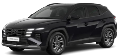
Abyss Black (A2B) Perlamutra krāsa