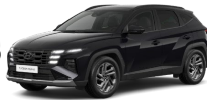
Abyss black (A2B), perlamutra krāsa