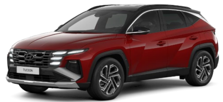
Ultimate Red/ melns jumts (R10)