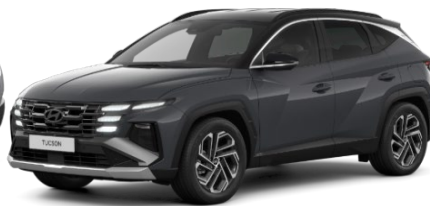
Ecotronic Grey (PE2), perlamutra krāsa Ecotronic Grey / Phantom Black jumts (PE0)