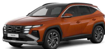
Jupiter Orange (PL2) Metāliska krāsa