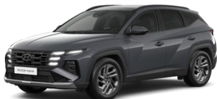
Ecotronic Grey (PE2) Perlamutra krāsa