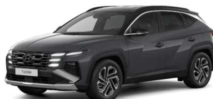
Ecotronic Grey / melns jumts (PE0)