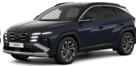
Sailing Blue / melns jumts (U20)