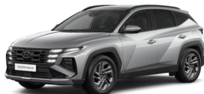
Shimmering Silver (R2T) Metāliska krāsa