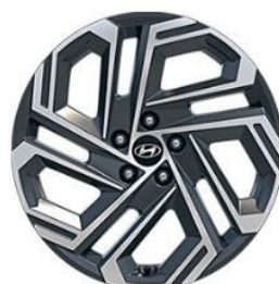
Premium 19" vieglmetāla diski 235/50/R19 riepas