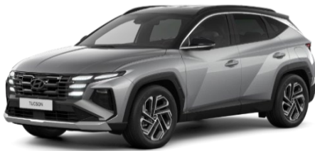
Shimmering Silver/ melns jumts (R24)