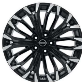
Tekna & N-Connecta 19" ar dimantu slīpēti vieglmetāla diski