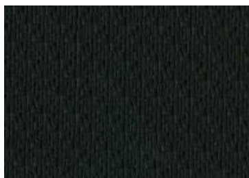
Izvēles aprīkojums N-Connecta Black – PVC ādas apdare