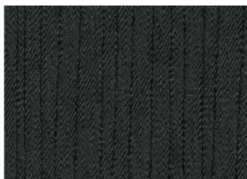
Acenta & N-Connecta Black – auduma apdare