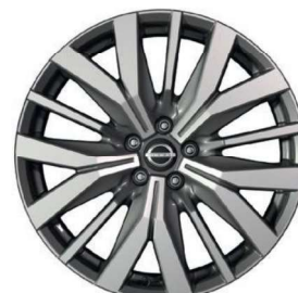
Tekna+ 20" ar dimantu slīpēti vieglmetāla diski