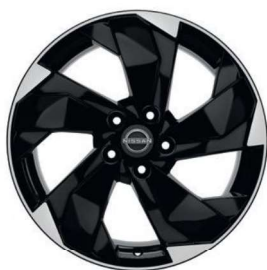
Acenta & N-Connecta 18" vieglmetāla diski